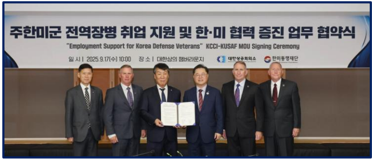
[ '대한상의-한미동맹재단' MOU 체결식 (9.17) ]